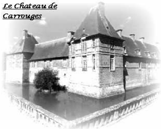
Le Château de Carrouges